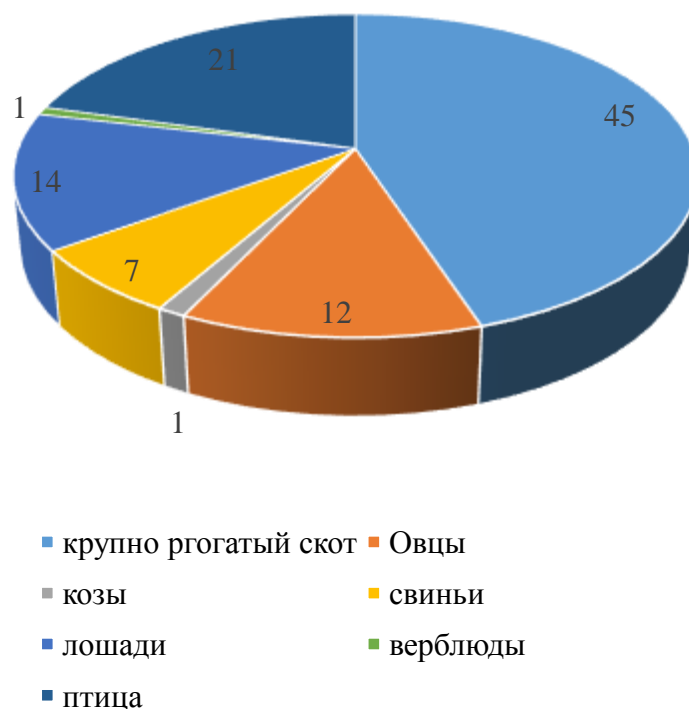
Рисунок 2. – Структура реализованной продукции животноводства Республики Казахстан за 2021 год в % к общему живому весу

По отрасли животноводстве в регионах Республики Казахстан сложилась следующая специализация: на севере преобладает молочное скотоводство и животноводство; на юге – коневодство, верблюдоводство, овцеводство и мясное скотоводство; на западе и востоке – коневодство и мясное скотоводство. Во всех регионах Казахстана птицеводство развивается равномерно. На Рисунке 2 представлена структура реализованной продукции животноводства Республики Казахстан за 2021 год в % к общему живому весу.