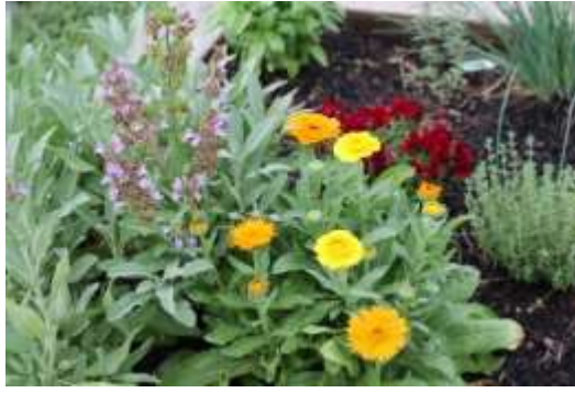
Рисунок 1. Низкорослые сорта

Низкорослые сорта используют для оформления бордюров. Они прекрасно смотрятся на клумбах с голубыми декоративными цветами- васильками. Календула также отлично смотрится в горшках для патио и смешанных бордюрах. Календулу можно посадить в любом саду и она прекрасно смотрится как в одиночной посадке, так и в сочетании с другими цветами [4].