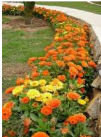
Рисунок 2. Calendula officinalis

Низкорослые сорта используют для оформления бордюров. Они прекрасно смотрятся на клумбах с голубыми декоративными цветами- васильками. Календула также отлично смотрится в горшках для патио и смешанных бордюрах. Календулу можно посадить в любом саду и она прекрасно смотрится как в одиночной посадке, так и в сочетании с другими цветами [4].