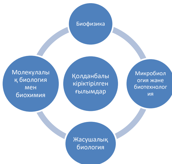
2 сурет -Қолданбалы кіріктірілген ғылымдар